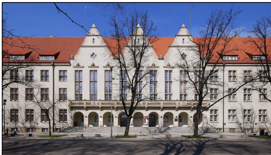
Widok budynku A-1 od wyb. St. Wyspiańskiego

Wejście do budynku jest od strony wyb. St. Wyspiańskiego, ul. C.K. Norwida oraz od dziedzińca.