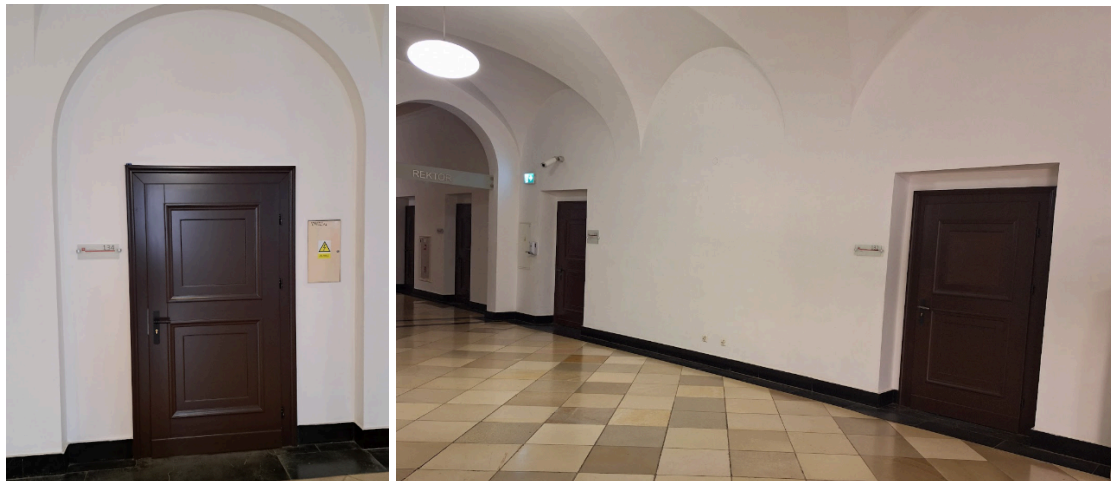
Zdjęcia zaproponowanych lokalizacji nowych tablic pamiątkowych