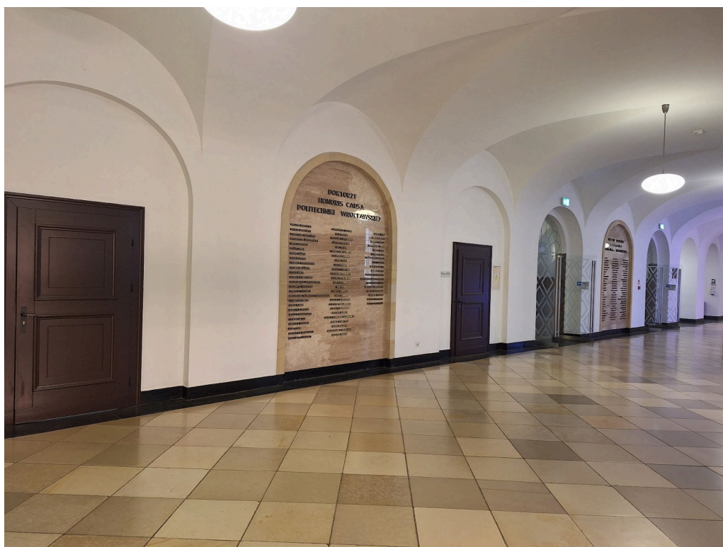
Zdjęcia istniejących tablic w korytarzu wysokiego parteru w bud. A1

Propozycję lokalizacji tablic przedstawiono w Załączniku nr 1 i 2 do niniejszego OPZ.