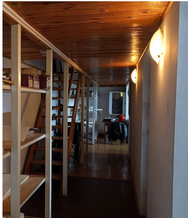
zdj. nr 7, 8 - pom. nr 214a i korytarz, widok wnętrza