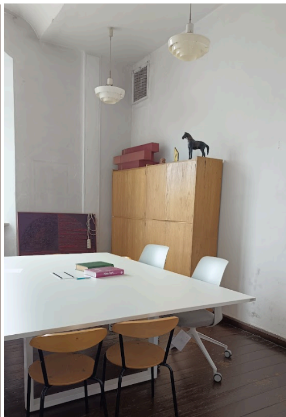
zdj. nr 9, 10 - pom. nr 214b i 214d, widok wnętrza