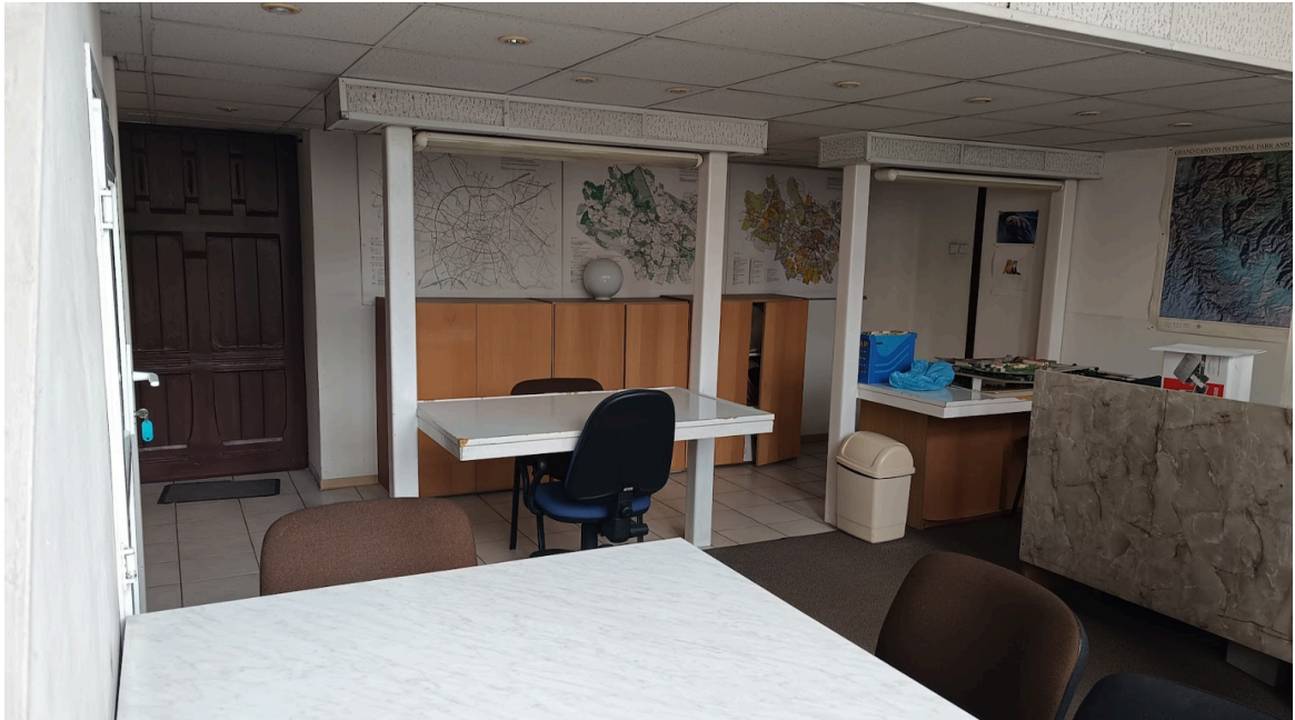
zdz. nr 2 – pom. nr 17, widok wnętrza