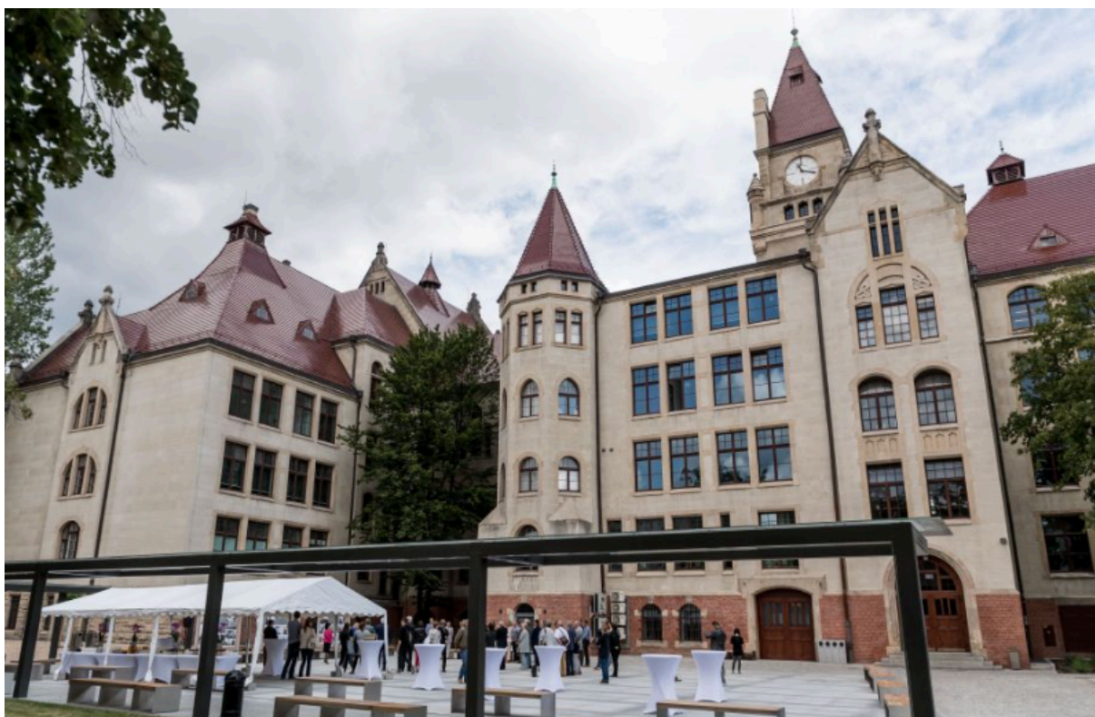
zdj. nr 1 - budynek E1, widok od strony dziedzińca

Zadanie dotyczy nieruchomości znajdującej się we Wrocławiu, w budynku E-1, wpisanym do Rejestru Zabytków miasta Wrocławia pod numerem 557/Wm (wpis z dnia 28.12.1995 r.). Obiekt zrealizowano w latach 1901-1907. Obecnie stanowi siedzibę Wydziału Architektury oraz Wydziału Elektroniki, Fotoniki i Mikrosystemów.