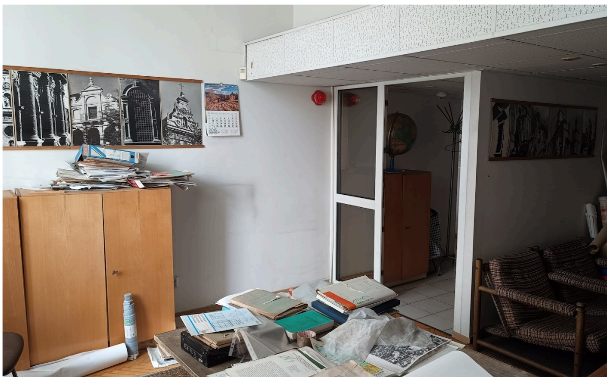
zdj. nr 4 - pom. nr 16, widok wnętrza