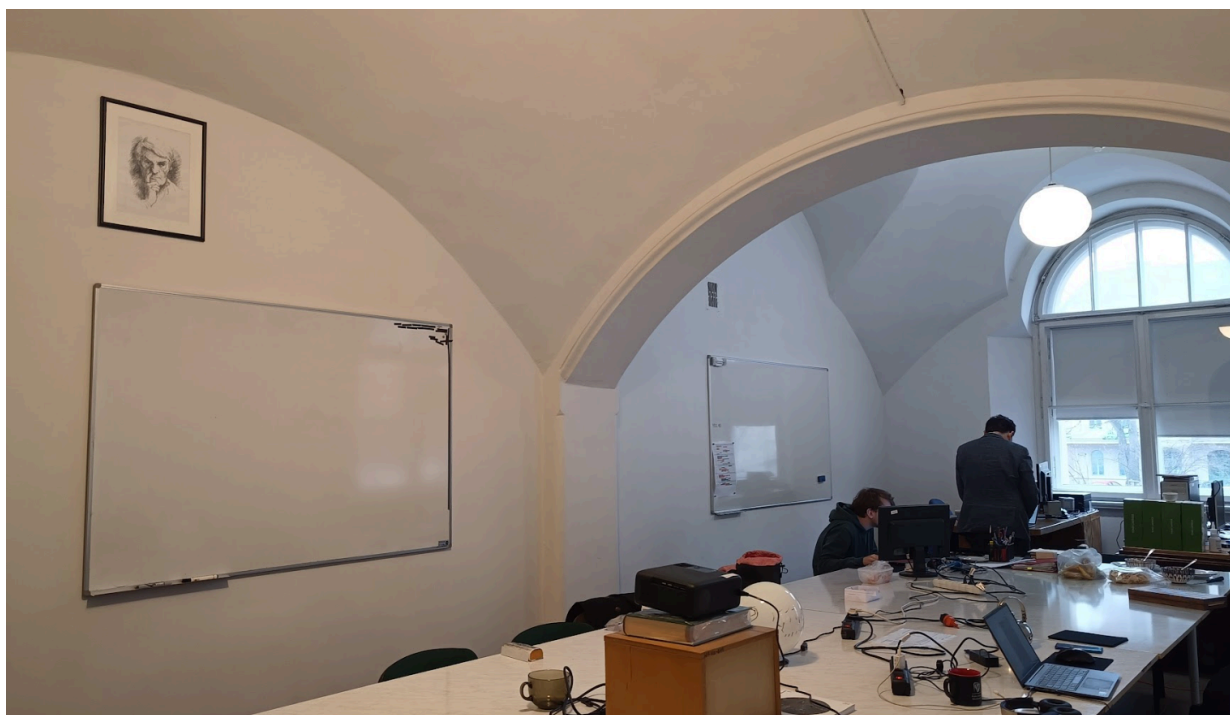
zdj. nr 6 - pom. nr 18, widok wnętrza