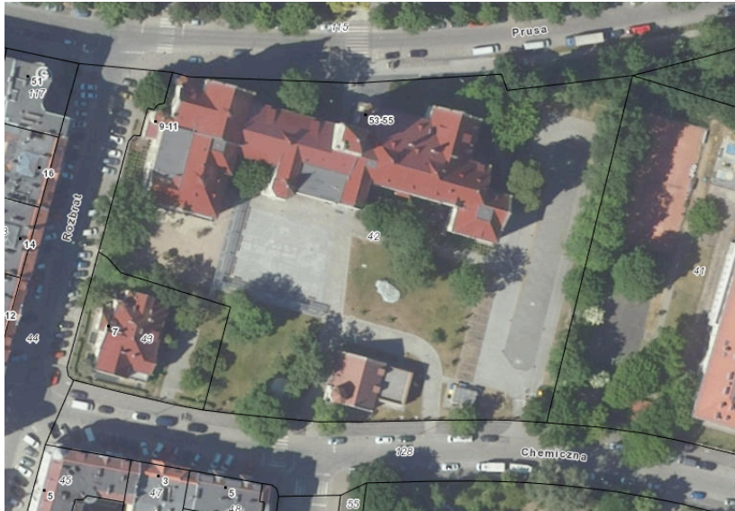
Rys. nr 1 – lokalizacja działki