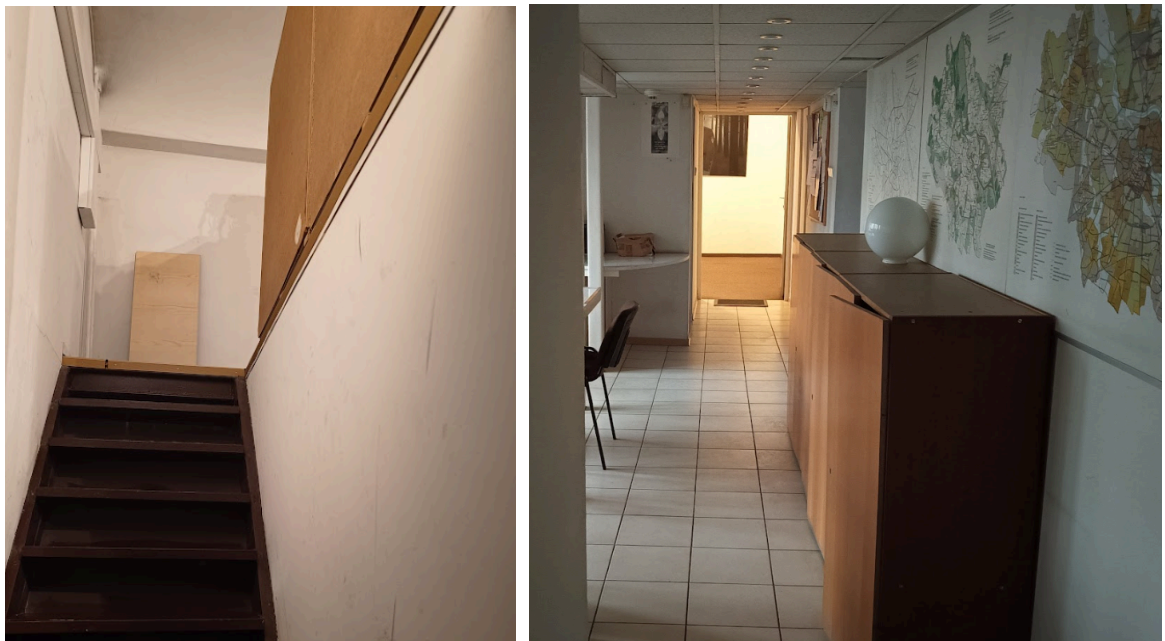
zdz. nr 3 - pom. nr 17, widok wnętrza